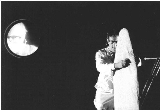
写真1 『月の向こう側』

上述の補助的な機能に加え、ルパージュ作品における映像の最も特徴的な使い方は、本来客席にいる観客には体験できない異なる視線を取り入れることにある。たとえば2000年に初演された『月の向こう側』での映像である。『月の向こう側』は、博士号取得を目指すうだつの上がない学生フィリップと、花形の天気予報士アンドレという対照的な兄弟の確執が和解に至るまでを、彼らがリアルタイムで経験したアメリカとソ連の冷戦に重ね合わせて描いた一人芝居である。『月の向こう側』というタイトルが示すように、本来「見えないもの」を「見せる」ことが作品の趣旨である。そのため、「見る」という行為そのものを考察させる工夫が随所に見られる。中でも顕著な例として、第19場で医者が幼少期のフィリップの目を診察する場面が挙げられる（写真1）。