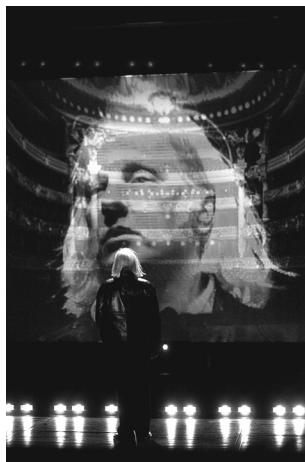
写真3『アンデルセン・プロジェクト』

スクリーンには、フレデリックの顔が大きく映し出される。それは、スポットライトを浴び、観客を見ているフレデリック、すなわちオペラ座の観客から見たフレデリックである。興味深いのは、その映像にオペラ座の客席が重ね合わされる点である。これはフレデリックから見た客席である。つまりこの場面では、フレデリックと観客という2方向からの異なる視線が、1つのスクリーン上で逢着するのである。そして、そのスクリーンに対峙する生身のフレデリックと、『アンデルセン・プロジェクト』という作品を観ている実際の観客の存在が、さらにその関係性を複雑にする。フレデリックは、オペラ座の観客を見る存在であると同時に、その観客から見られる存在でもある。そしてスクリーンの前に佇む生身のフレデリックは、スクリーン上に映った自分の顔、つまりオペラ座の観客に見られている自分の映像をも見ている。これにより、フレデリックはオペラ座の観客と視線を共有することになる。ルパージュの『アンデルセン・プロジェクト』を観て